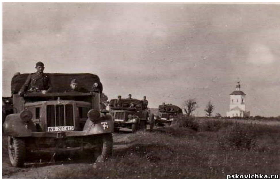
1 Нанomag H K1 6, 3-тонный полугусеничный транспортёр Sd.Kfz.11 1-й батареи 19-й танковой дивизии севернее Куньи, Псковская обл..