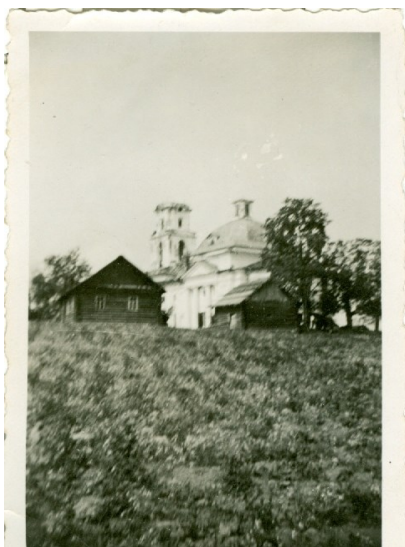
Усмьнь. Немецкая фотография. 06.08.1941 г.