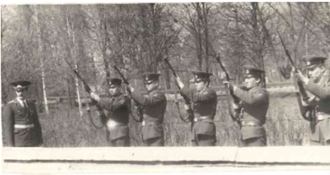
9 мая в 80-е годы (материалы архивного отдела Администрации Куньинского района)