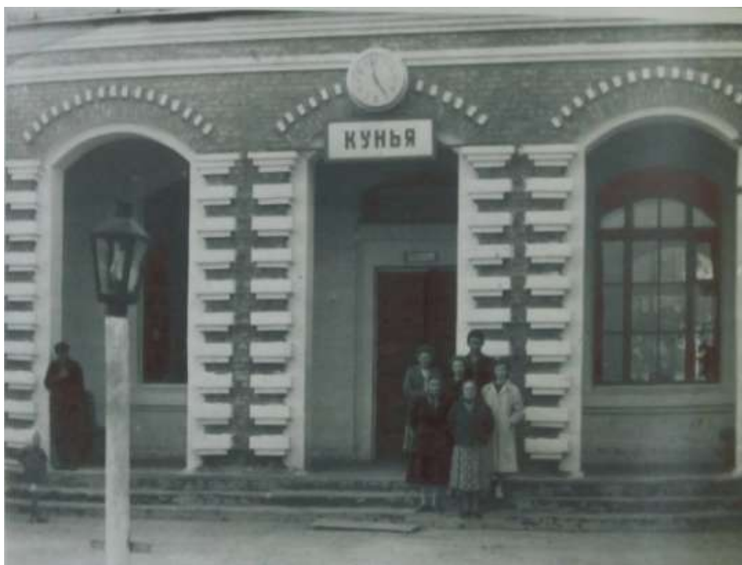
Здание вокзала в 50-е годы