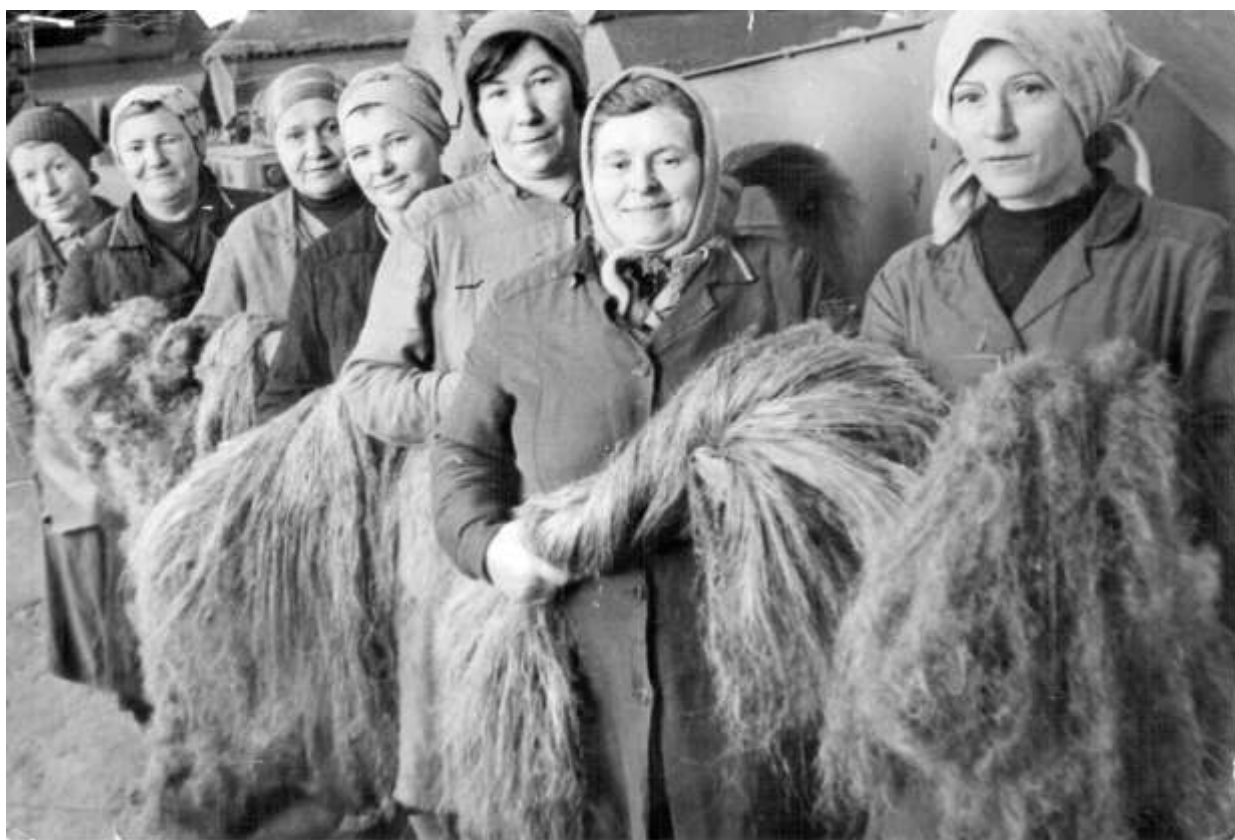
Коллектив льнозавода в 80-е годы (материалы краеведческого музея)