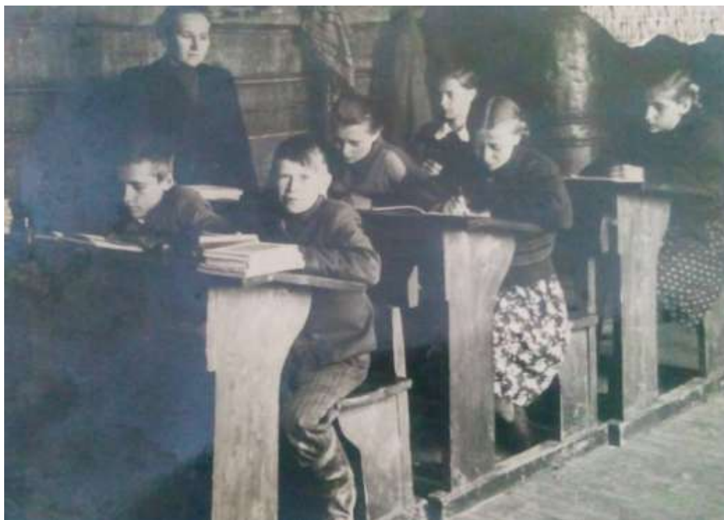
Обучение в Кунынской школе в 50-е годы