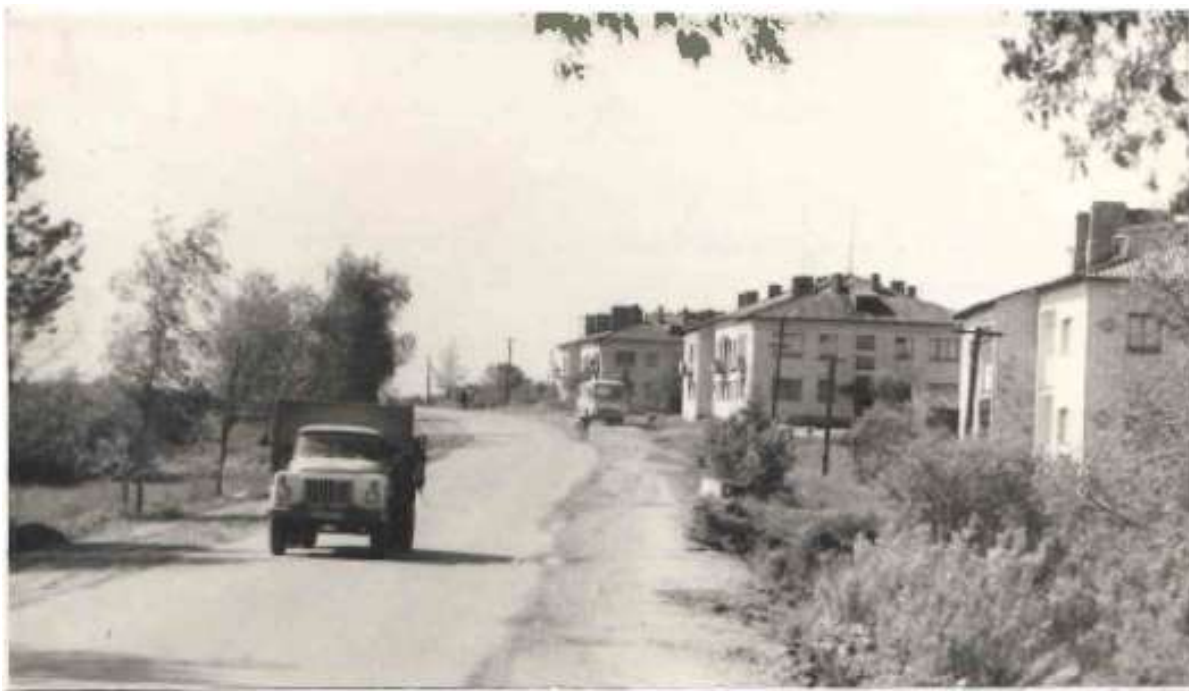
Улица Дзержинского, конец 80-х – начало 90-х годов (материалы архивного отдела Администрации Куньинского района)