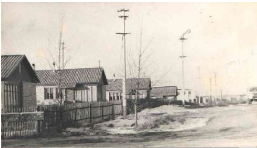
Улица Полевая в конце 80-х – начале 90-х годов (материалы архивного отдела Администрации Куньинского района)