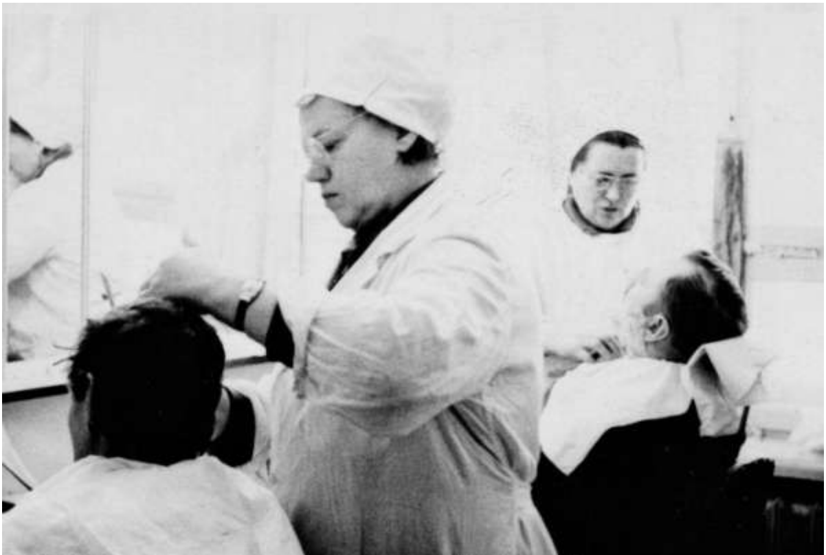
Парикмахерская в 80-е годы