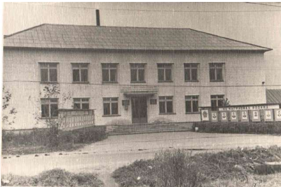
Здание райисполкома в 70 - 80-х годах (сегодня – здание Администрации района)