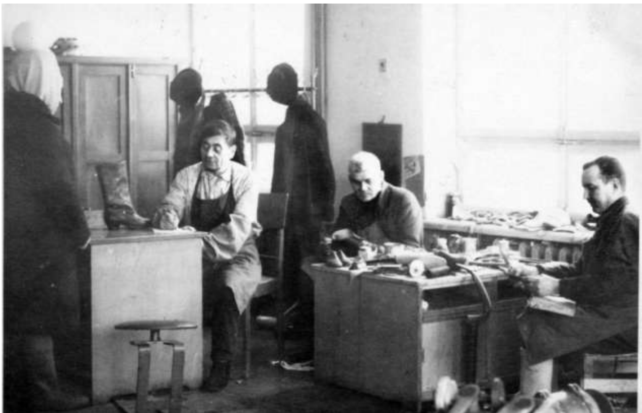
Обувной цех в комбинате бытового обслуживания в 80-е годы (материалы краеведческого музея)