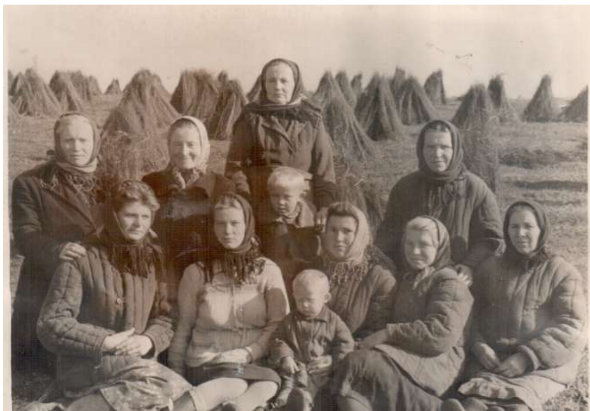
На уборке льна, 1955 год