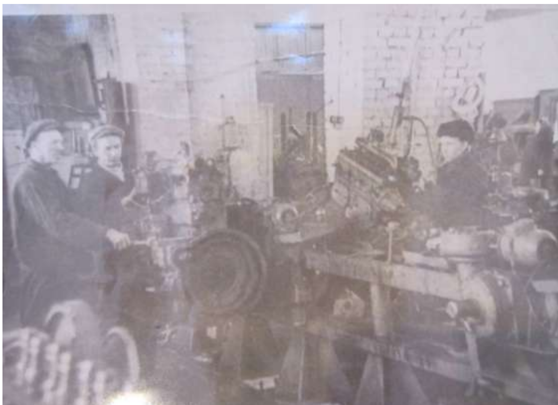
Столярный цех в 60 - 70-е годы