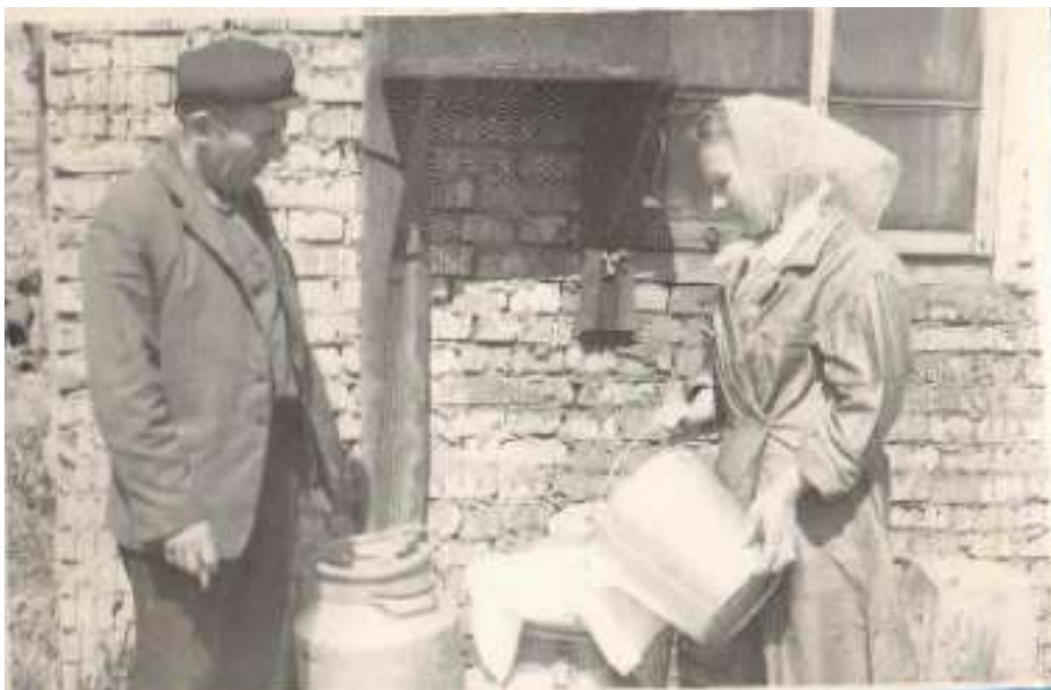
Молокозавод, 60-70-е годы