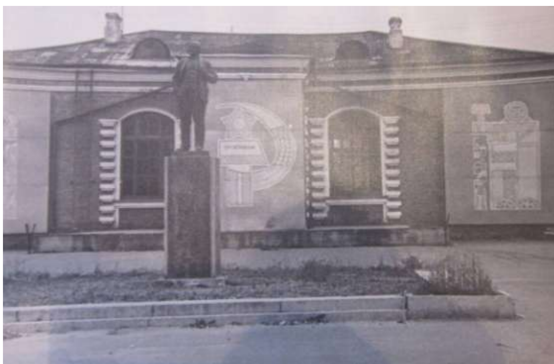
Здание вокзала в 60-70-е годы