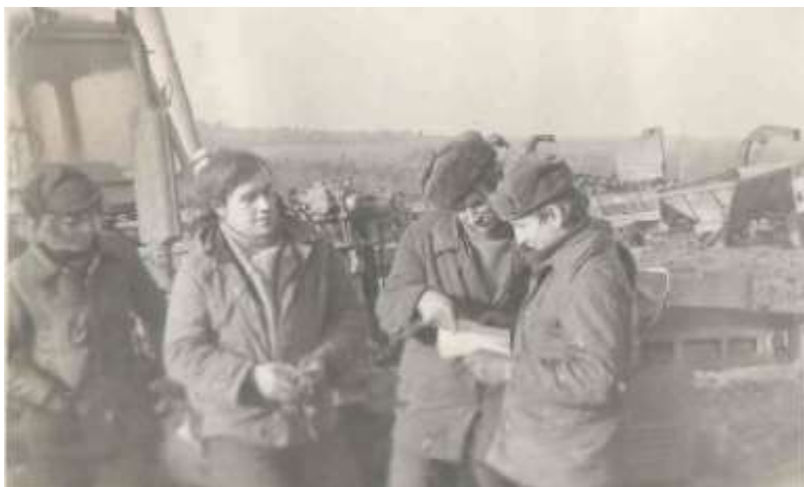
Полевые работы в 60-70-е годы (материалы архивного отдела Администрации Куньинского района)