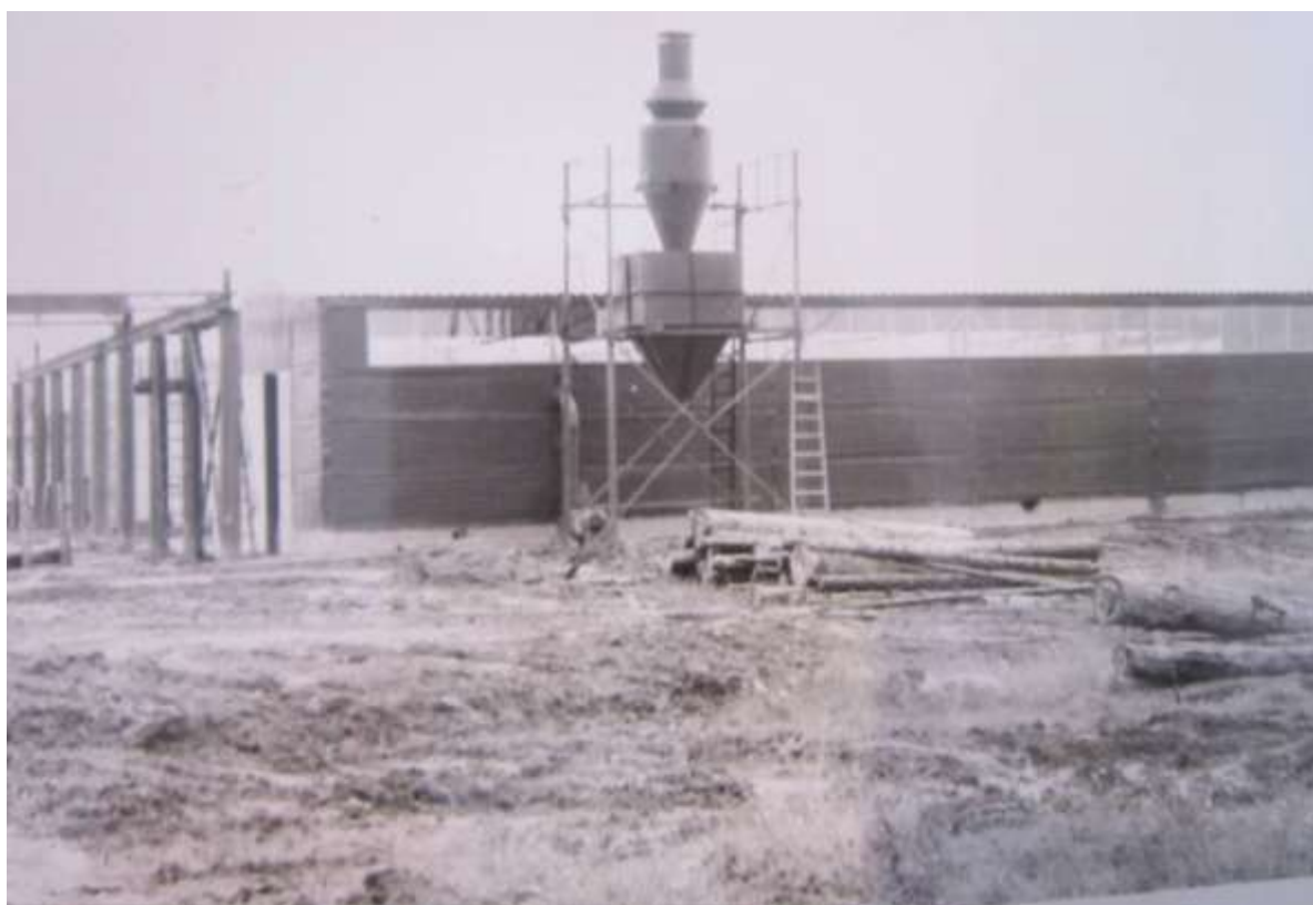
«Сельхозхимия» в 70-80-е годы (материалы краеведческого музея)