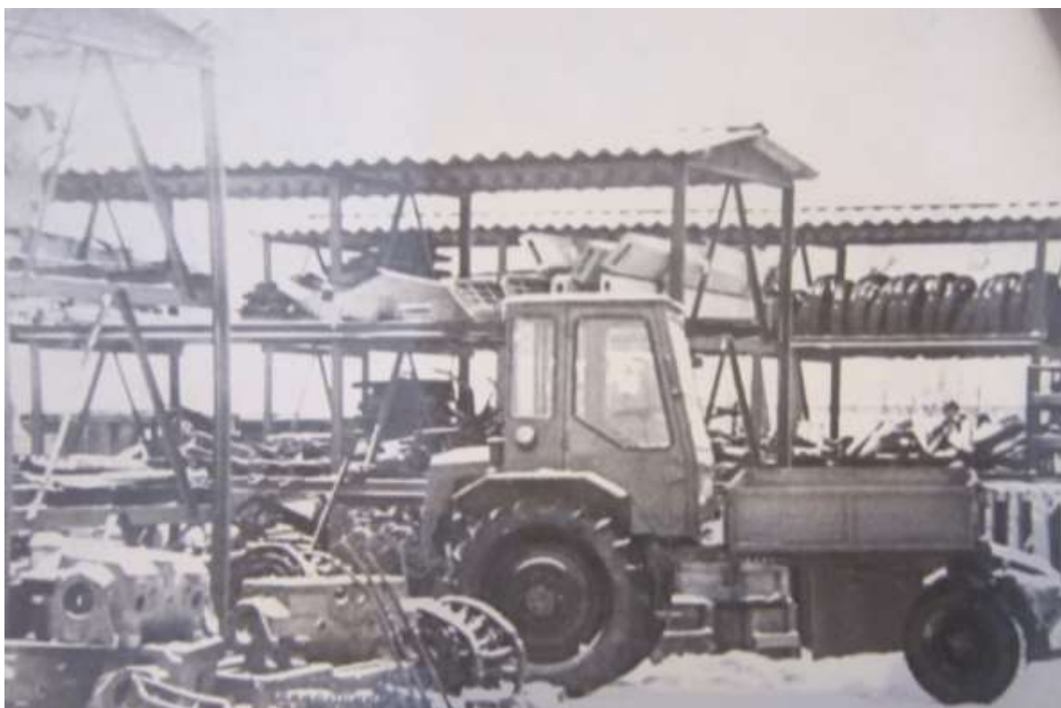
«Сельхозтехника» в 60 - 70-е годы