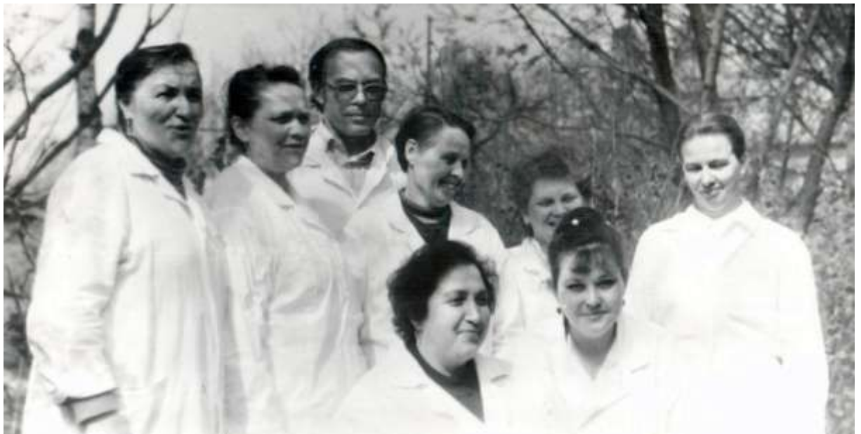
Коллектив аптеки в 80-е годы (материалы краеведческого музея)