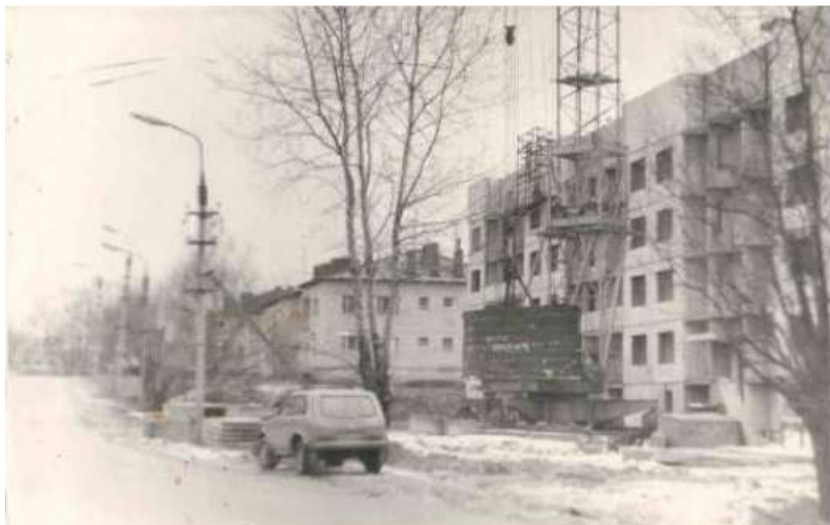
Строительство нового жилого дома на ул. Дзержинского, 1992 г.