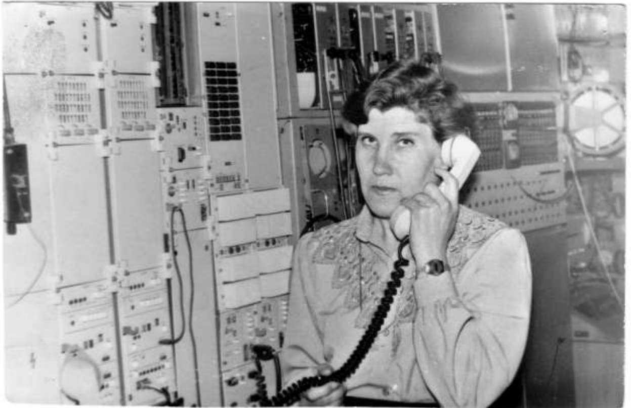
Отделение связи в 80-е годы (материалы краеведческого музея)