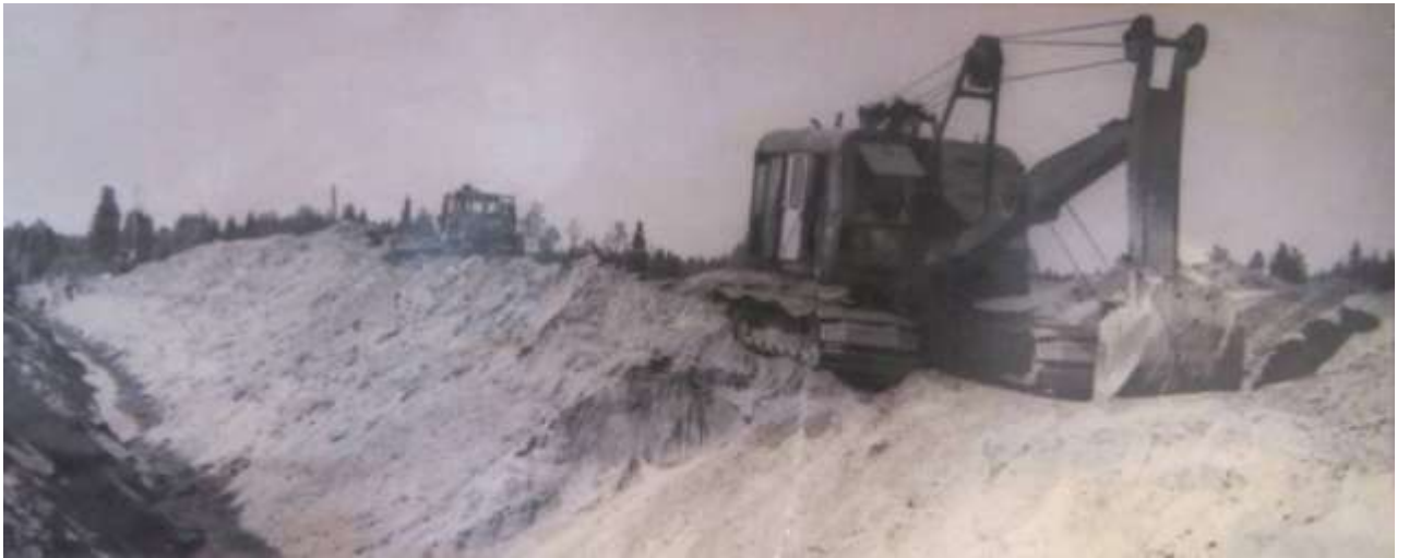
ПМК-12, мелиоративные работы