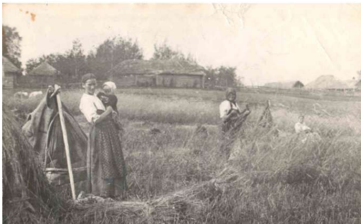
Уборка ржи в 40-х годах