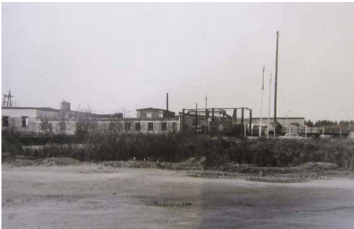
«Сельхозхимия» в 70-80-е годы (материалы краеведческого музея)