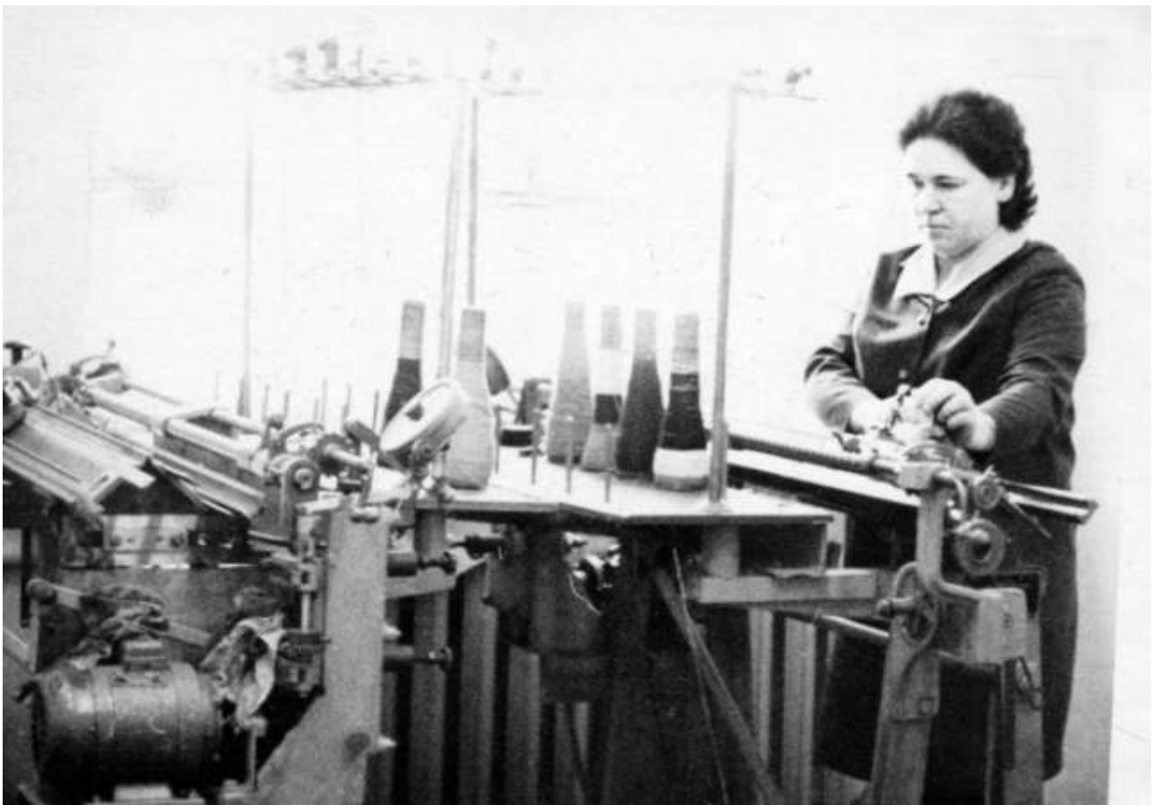
Пошив одежды в комбинате бытового обслуживания в 80-е годы