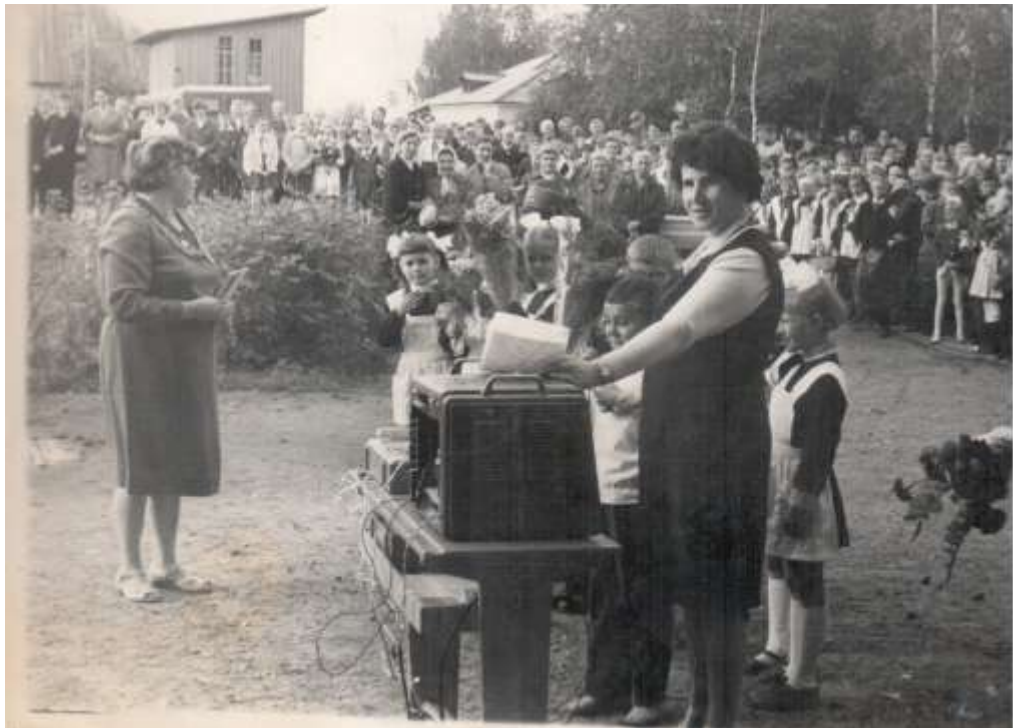
1 сентября 1973 года в Куньинской школе