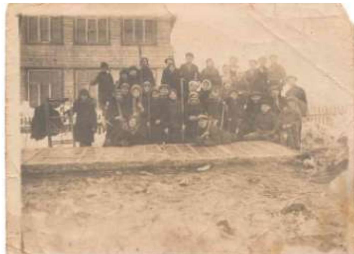
Закладка парников 9 марта 1941 года