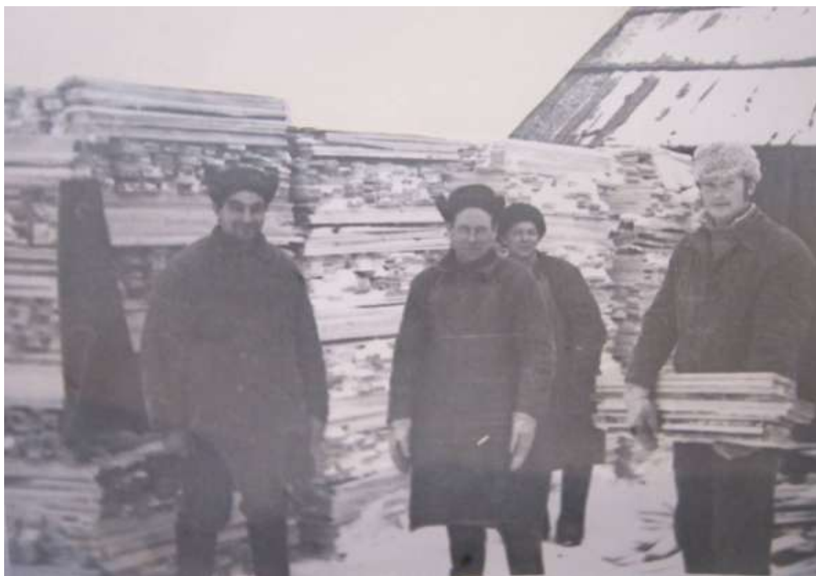
«Лесхоз», 1975 год