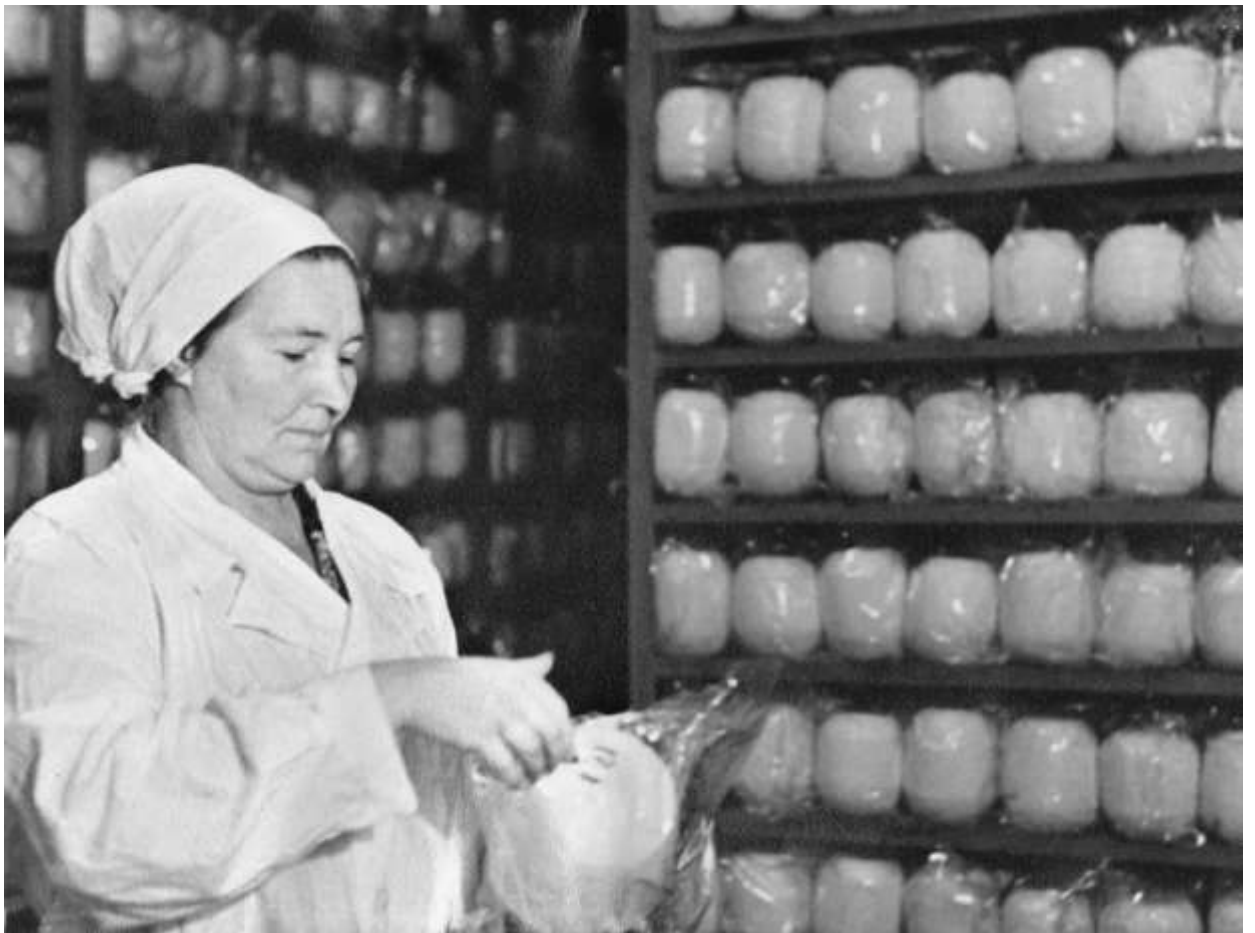
Маслосырзавод в 80-е годы (материалы краеведческого музея)