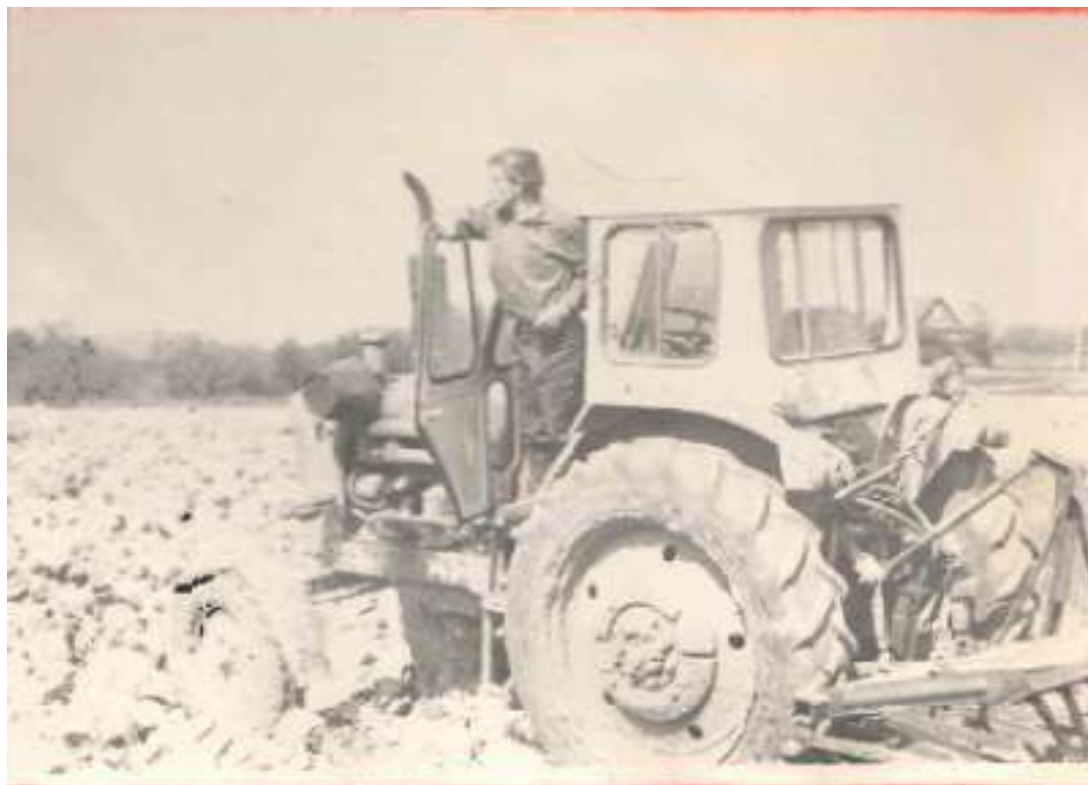
Полевые работы в 70-е – 80-е годы (материалы архивного отдела Администрации Куньинского района)