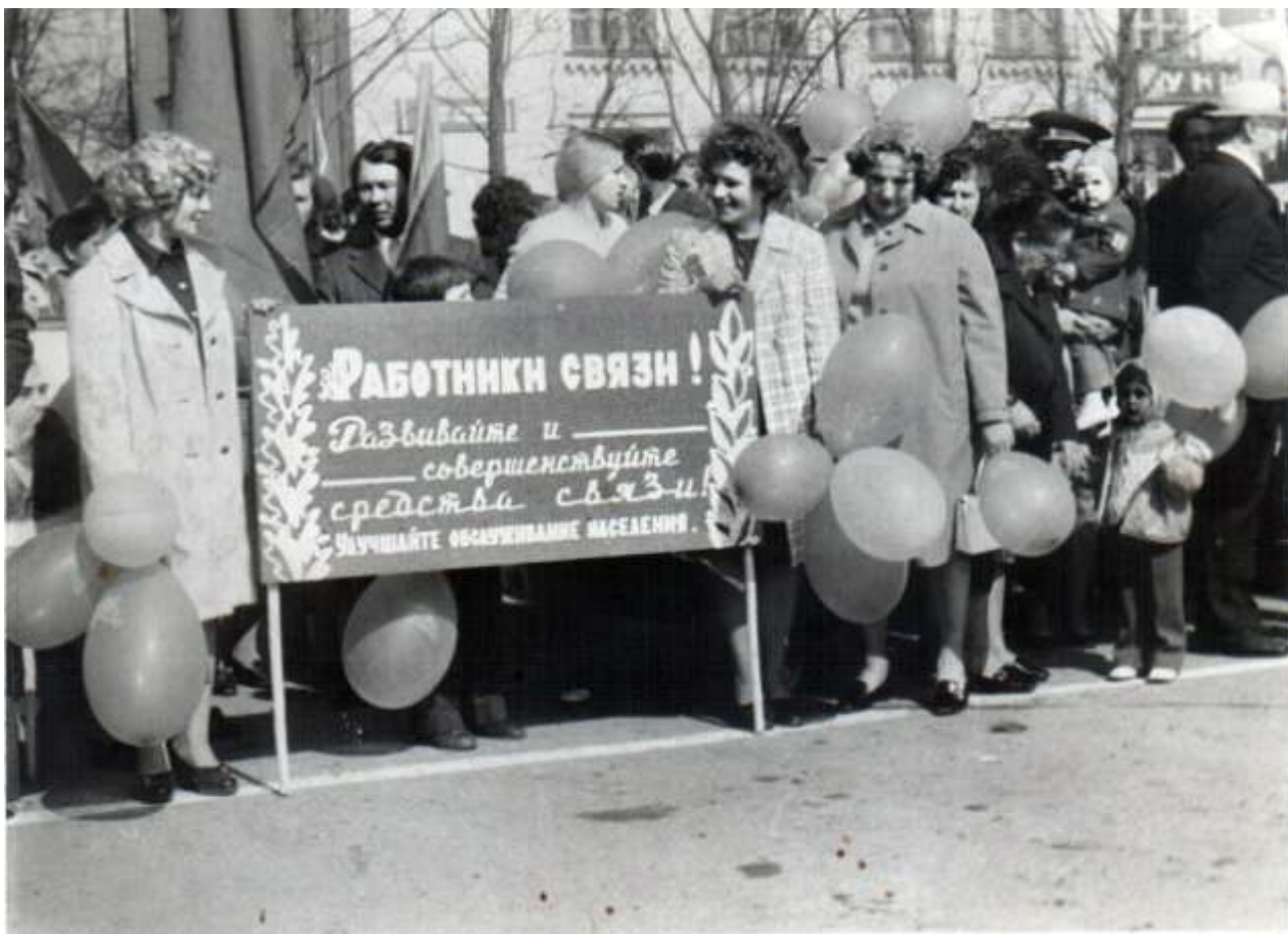
Демонстрация 1 Мая 1977 года