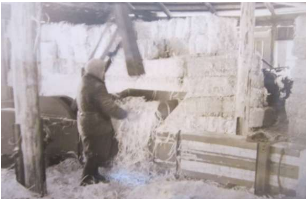
«Лесхоз», 1975 год