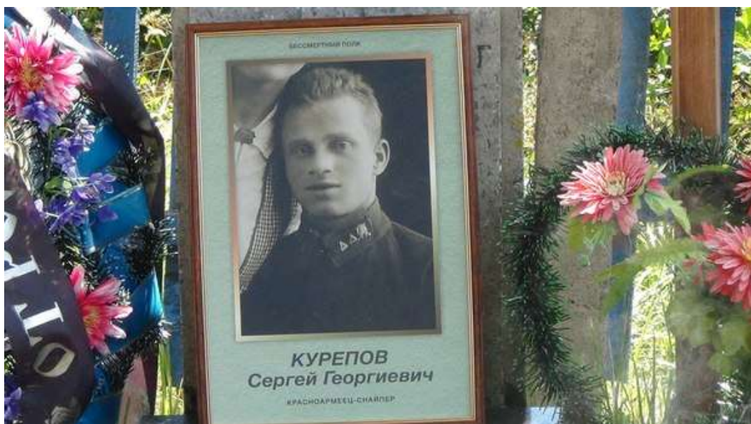
Перезахоронение в д. Хлебаниха в августе 2014 г.