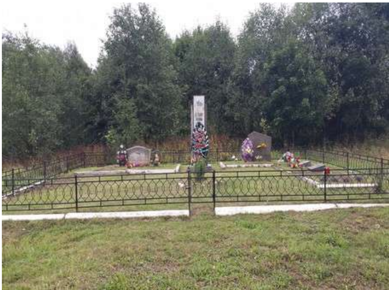
Воинское захоронение в д. Слепнево