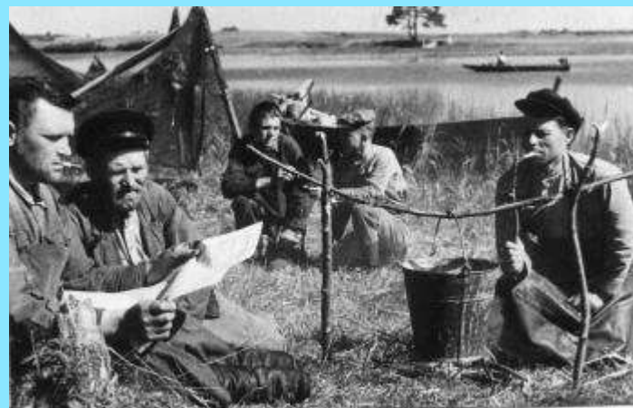
ГРУППА РЫБОЛОВОВ КУНЬИНСКОГО РЫБХОЗА НА ОТДЫХЕ В ОБЕДЕННЫЙ ПЕРЕРЫВ У ОЗЕРА ЖИЖИЦА. Дата съемки - 1948 г.

Именно из Жижицкого озера в 1959 году судак был впервые завезен в бассейн Верхней Оби (Новосибирское водохранилище) в количестве 2,1 миллиона личинок.