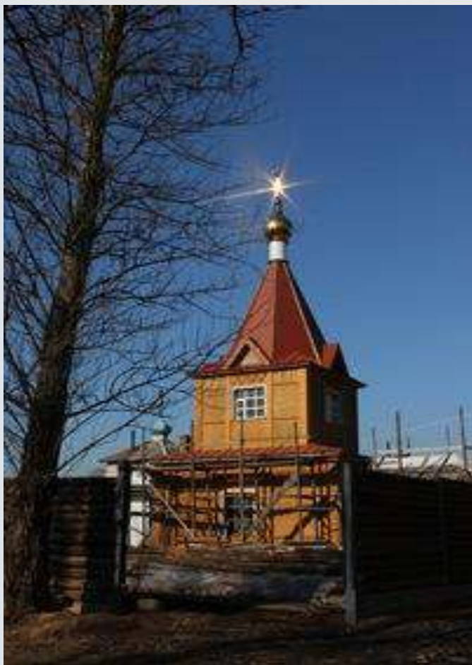
Храм Святителя Тихона, п. Кунья

После посещения музея экскурсия продолжается в храме Святителя Тихона, расположенном в 5 минутах ходьбы от краеведческого музея