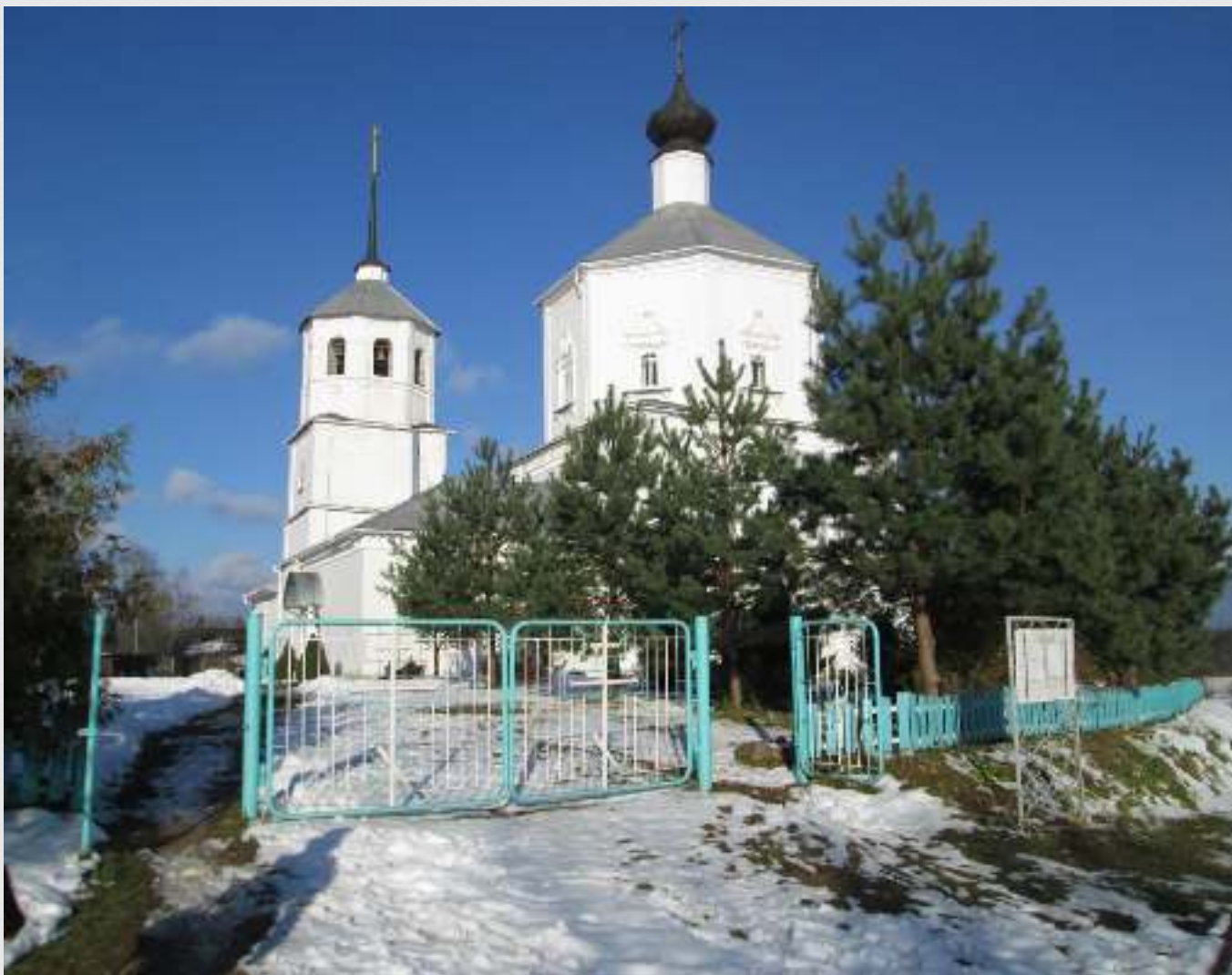
Церковь Воскресения Христова в 2016г.