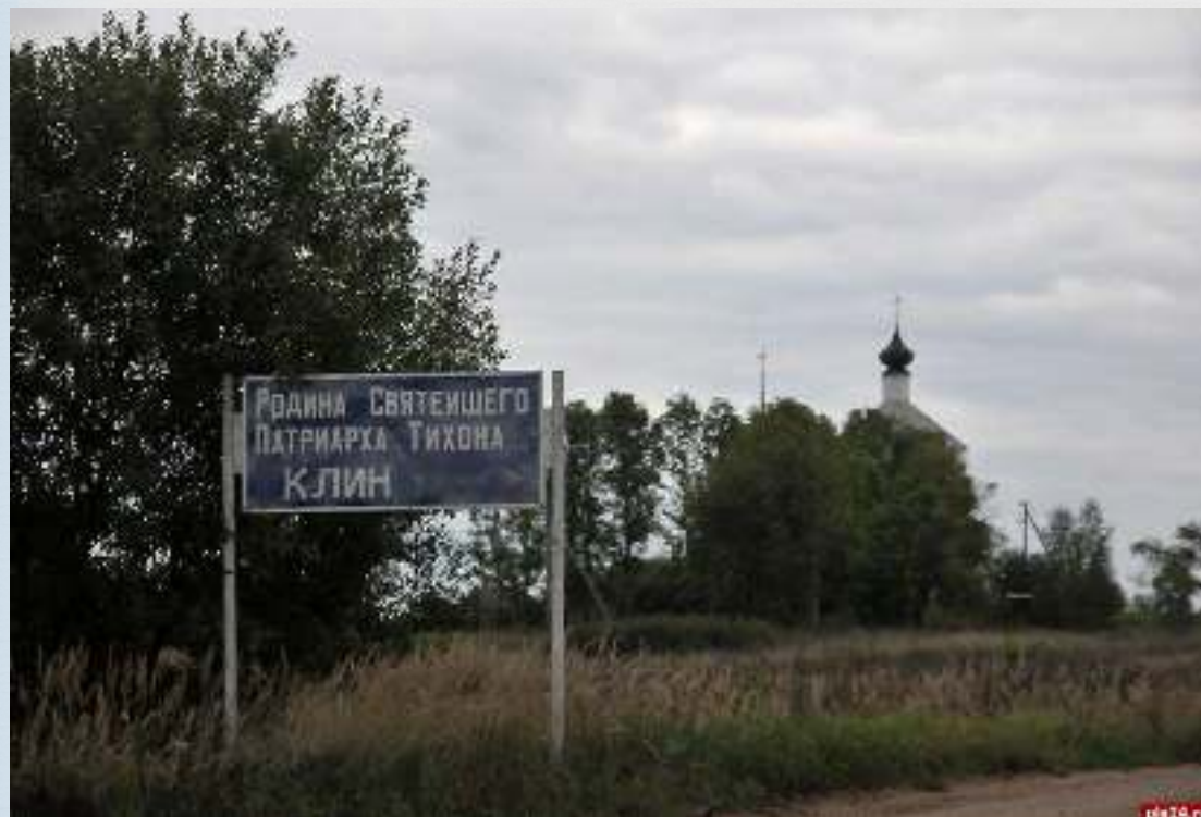
Дорога к храму

Клин известен как древний город, первое упоминание которого в летописях относится к 1131 году.