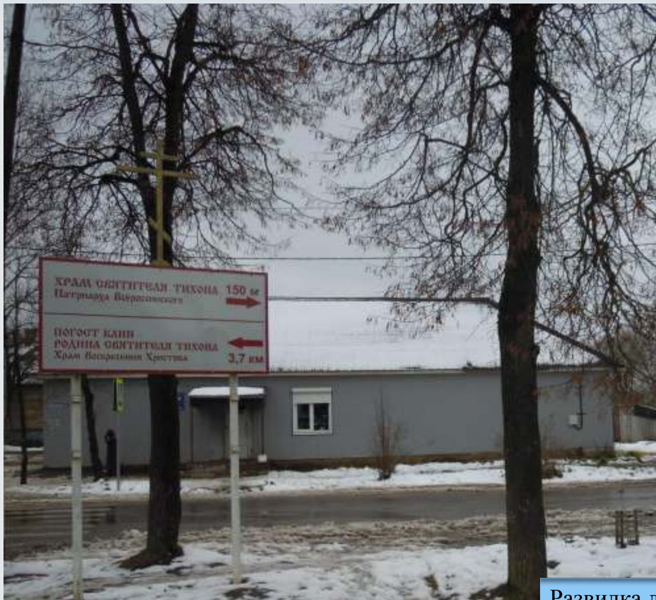
Развилка дорог у Кунынского краеведческого музея