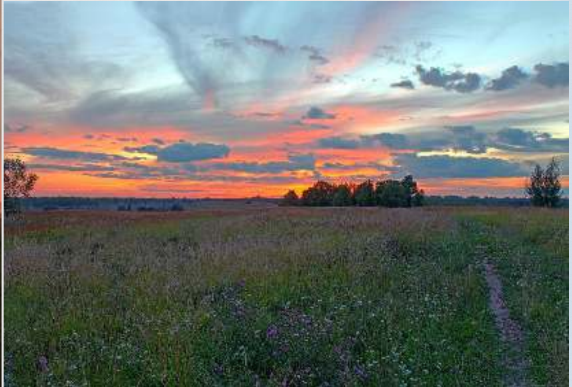
Родные места Патриарха...