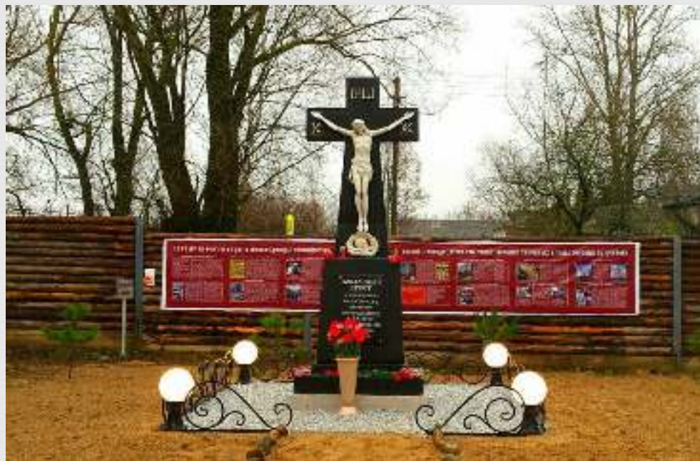
Поклонный крест на территории храма