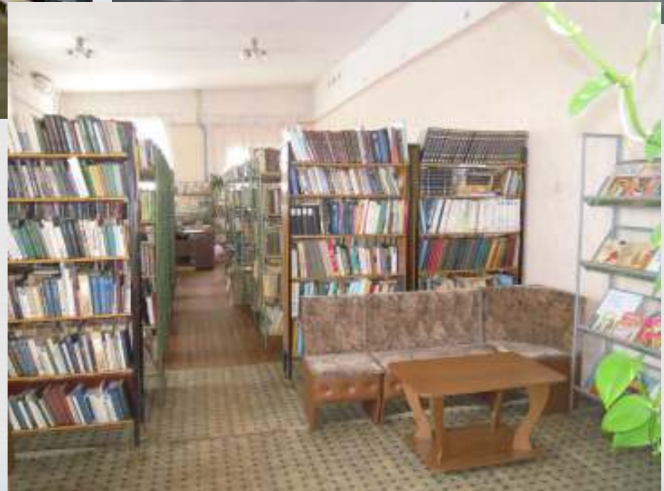
Куньинская центральная районная библиотека