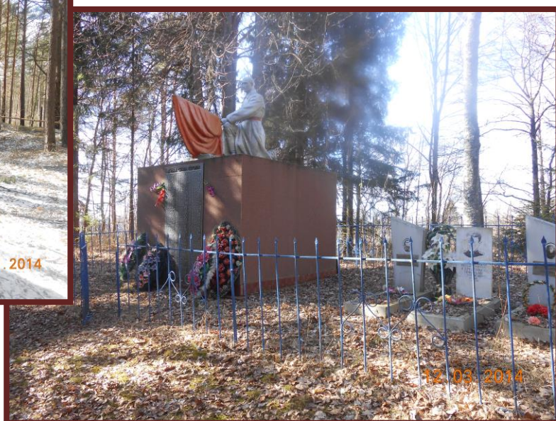
Красный посёлок Путилы